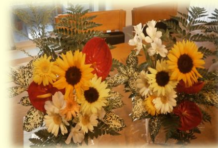
～フラワーアレンジメント講座より～